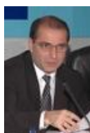
Тосунян Гарегин Ашотович, Президент Ассоциации российских банков