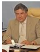
Питерский Леонид Юрьевич, Вице-президент национального объединения саморегулируемых организаций в области энергетического обследования