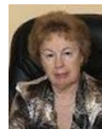
Сазонова Мария Ивановна, Президент Федеральной нотариальной палаты