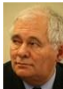
Рошаль Леонид Михайлович, Президент Национальной медицинской палаты