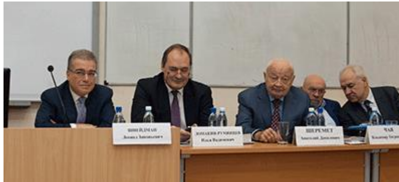
Фотоотчет с конференции »

15 ноября в г. Москве прошла Международная научно-практическая конференция: «Актуальные проблемы реформирования аудита: международный опыт и российская практика» , посвященная 75-летию создания Экономического факультета МГУ имени М.В. Ломоносова.