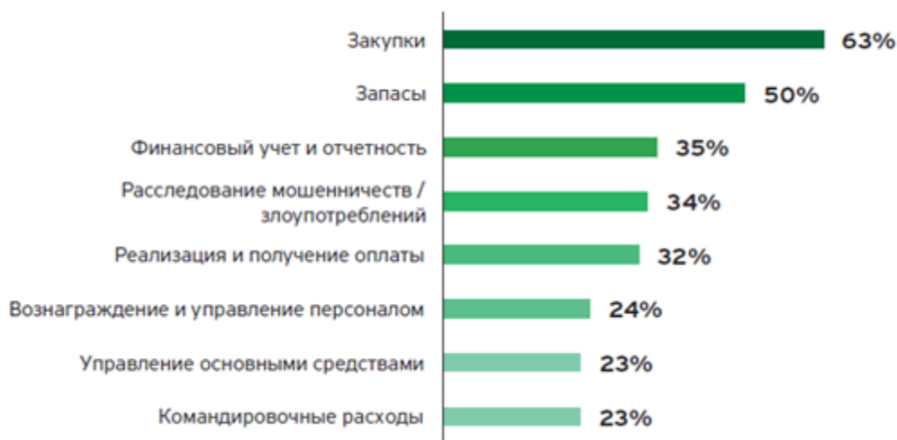
Для каких типов аудита СВА применяют анализ данных