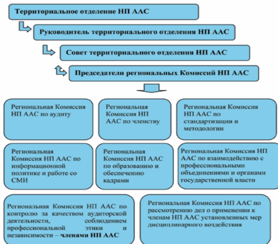
Рис. 3. Структура территориального отделения НП ААС

Руководством НП ААС решен вопрос о распределении ответственности членов Совета ТО, т. е. за каждым членом закреплена профильная региональная комиссия.