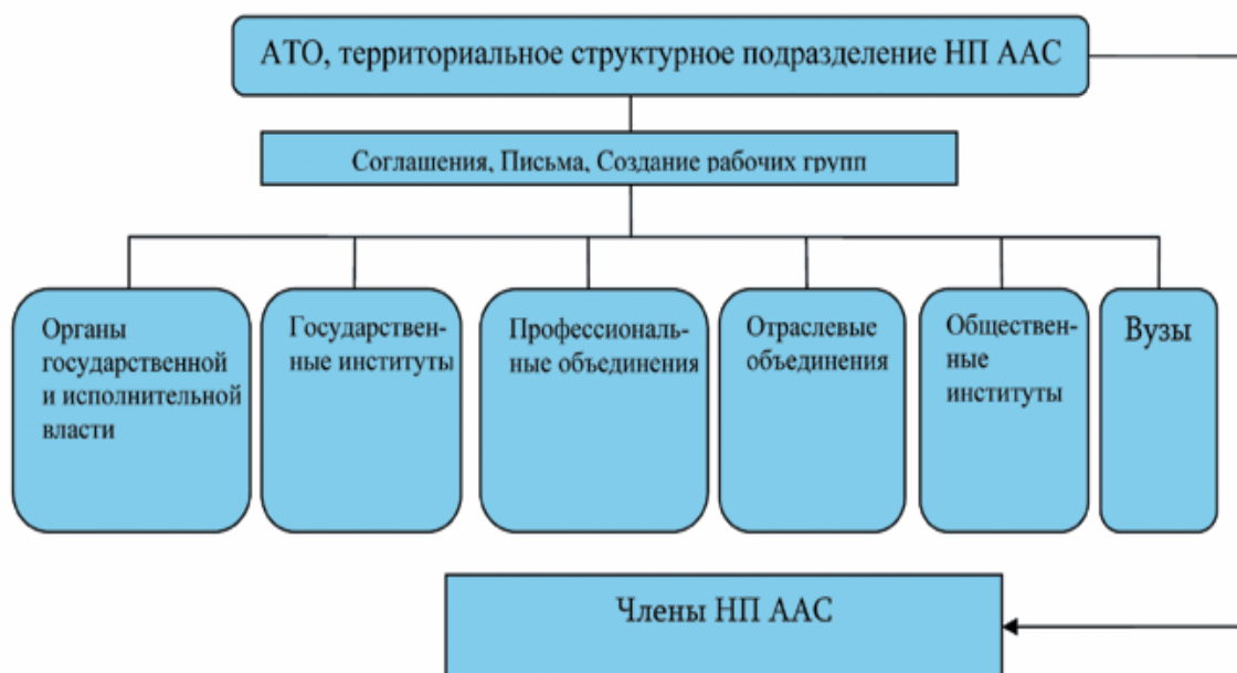
Рис. 1. Взаимодействие территориальных подразделений НП ААС с внешним окружением

НП ААС формирует организационную структуру и строит свою деятельность в регионах с учетом разумного распределения своих функций между органами управления НП ААС, ее территориальными структурными подразделениями и автономными территориальными организациями, что позволяет создать сильную вертикально интегрированную структуру профессионального сообщества на благо развития профессии.