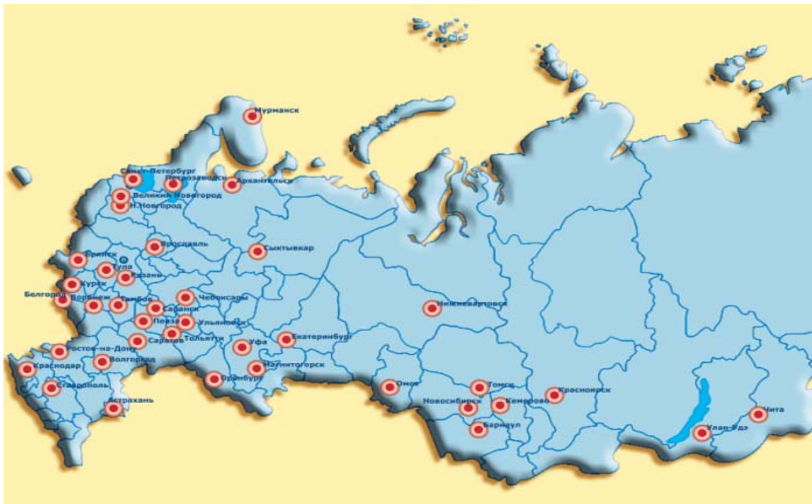
Рис. 2. Региональная сеть НП ААС