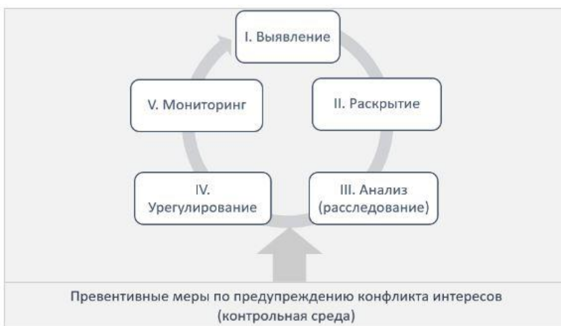
Рис. 1. Схема жизненного цикла управления рисками, связанными с реализацией конфликта интересов

Этап I. Как видно из схемы, приведенной выше, этап выявления (идентификации) конфликта интересов является основополагающим и ключевым и при этом наиболее сложным в жизненном цикле. Можно выделить 2 подхода к выявлению конфликта интересов: